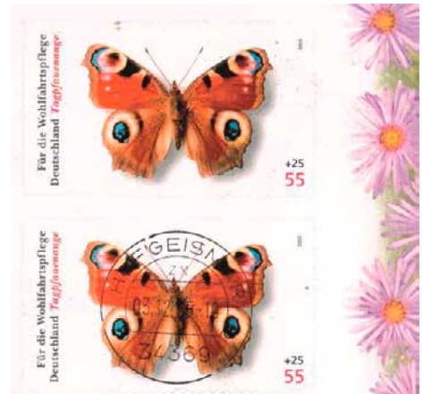
aus MH 60

Nach dem Wegfall der Berliner Ausgaben durch die Vereinigung 1990 klagten die Wohlfahrtsverbände überzunehmend sinkende Einnahmen durch die Zuschläge von Wohlfahrtsmarken. So war es dann ein echtes Weihnachtsgeschenk für die Verbände, dass die Deutsche Post am 1. Dezember 2005 den 55 Cent - Hauptwert der Wohlfahrtsmarkenausgabe Schmetterlinge zusätzlich selbstklebend (Mi.-Nr.: 2504) herstellen ließ. Von Anfang an erschienen die selbstklebenden Wohlfahrtsmarken in zwei Konfektionierungen: Als Markenset (MH 60) mit 10 Marken und als Markenbox mit 100 Marken.